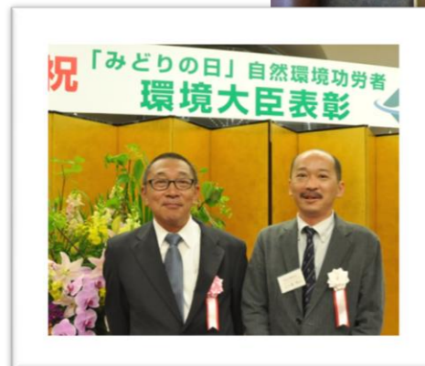
表彰式（新宿御苑にて）